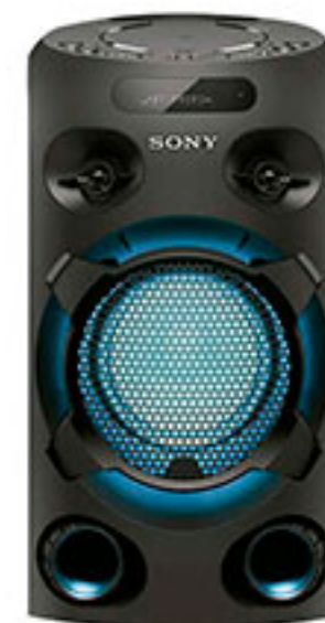
Sistema de audio de alta potencia con te SONY