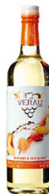
Cooler durazno VERAU 750ml $58 00