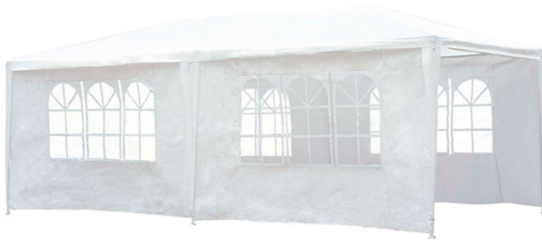
Gazebo paredes 3x6 $1,498 00