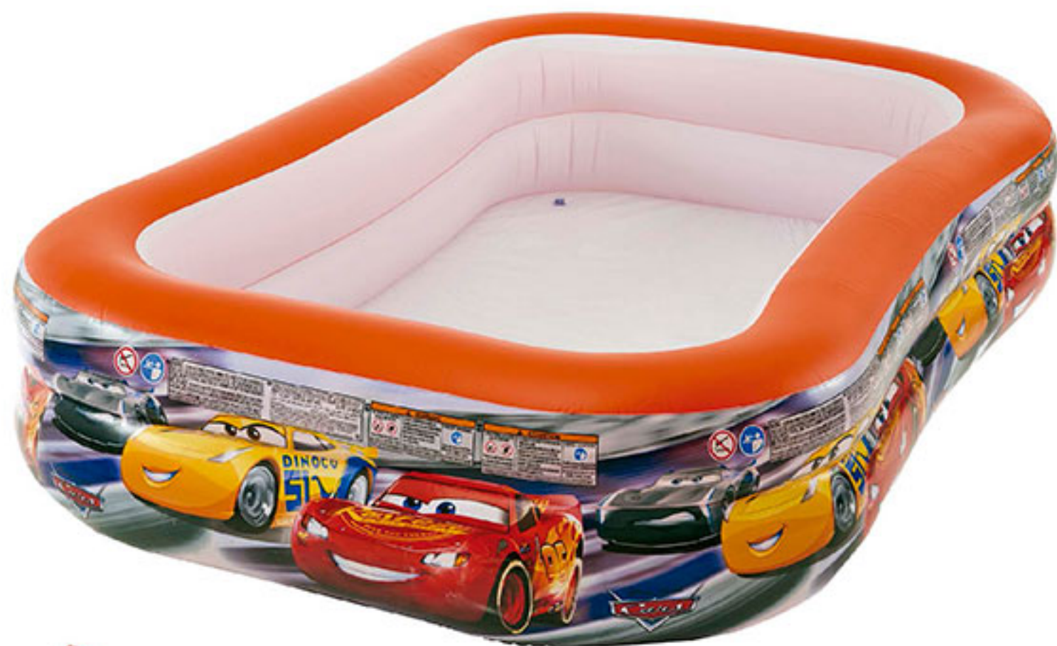
Alberca familiar cars INTEX $898 00