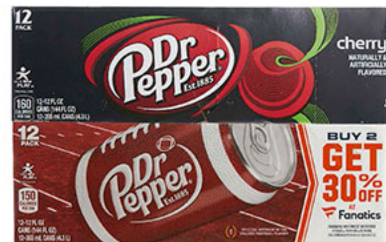
12 pack refresco DR. PEPPER 355ml