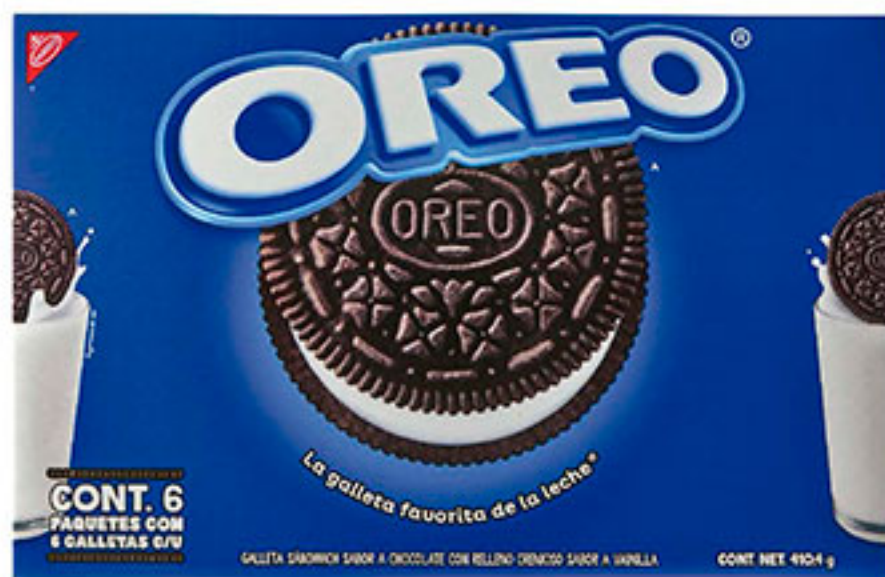
Galletas OREO 410g