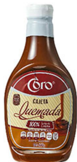
Cajeta quemada leche de cabra CORO 660g