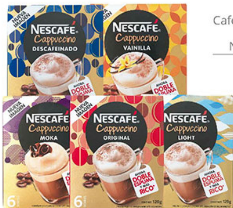
Café para preparar cappuccino NESCAFÉ 6pz $35 50 C/U