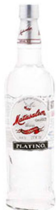
Ron blanco MATUSALEM 750ml