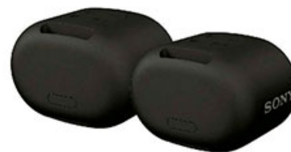
Bocina portátil extra bass con bluetooth SONY