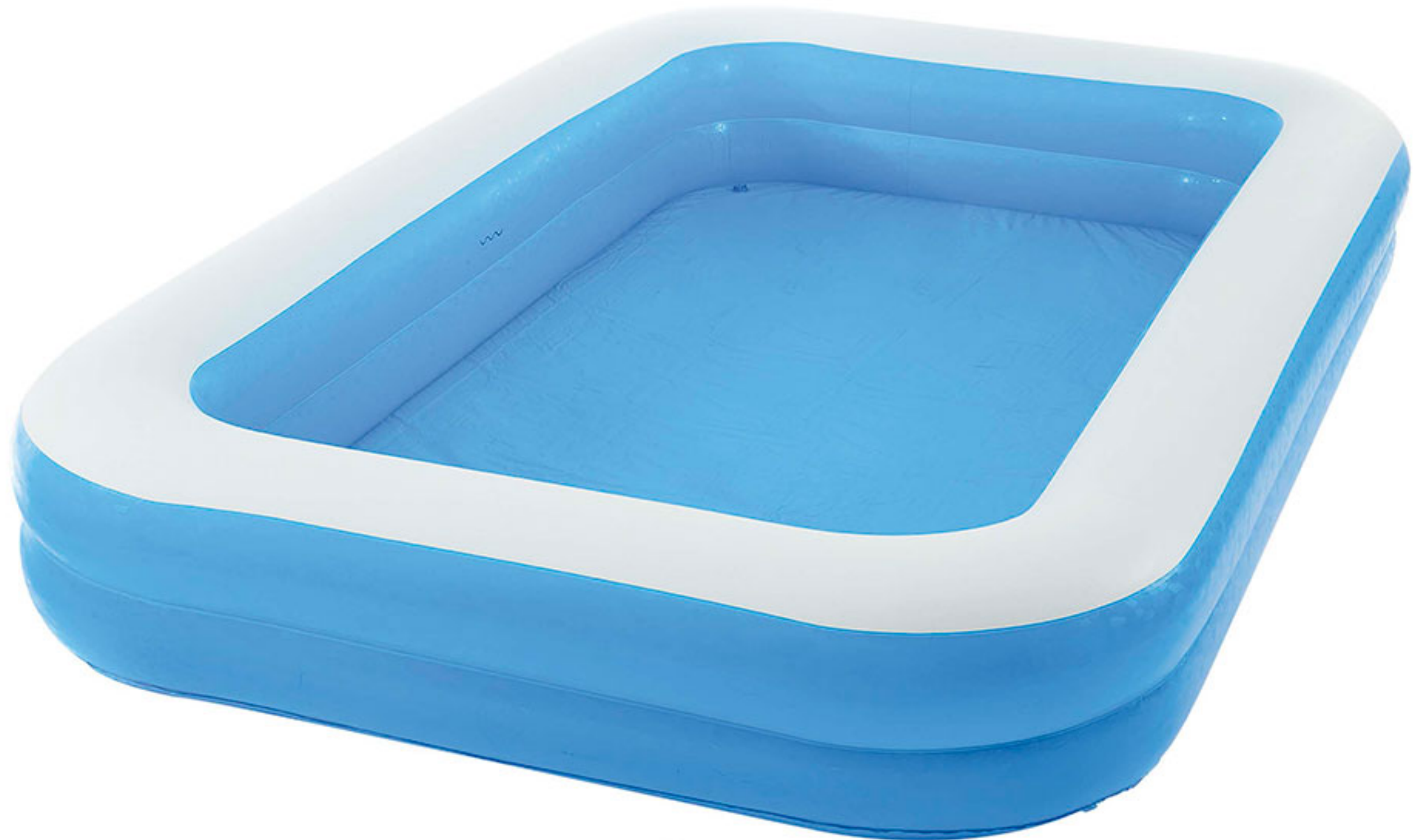
Alberca inflable familiar BESTWAY