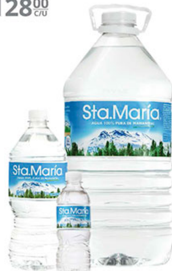
Agua natural STA. MARÍA compra una y llévate