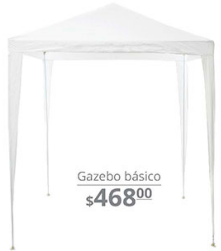
Gazebo básico $468 00