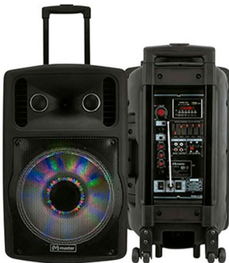
Bafle amplificado 12" bluetooth MASTER