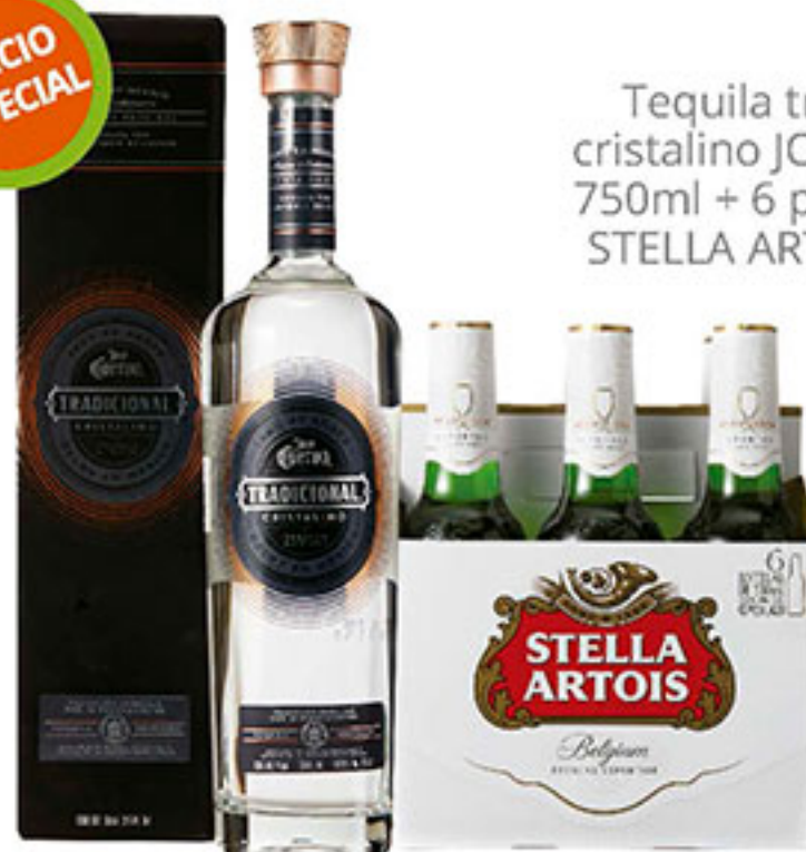
Tequila tradicional cristalino JOSE CUERVO 750ml + 6 pack cerveza STELLA ARTOIS 330ml