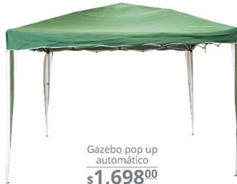
Gazebo pop up automático $1,698 00