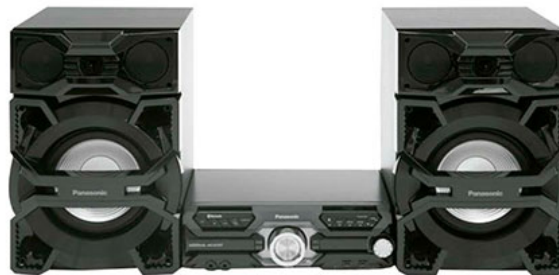
Minicomponente 26,400W PANASONIC