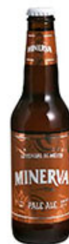
Cerveza pale ale MINERVA 355ml