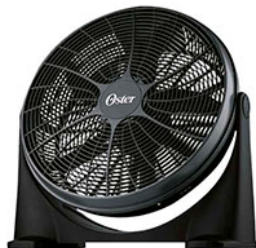
Ventilador de piso 21" OSTER $998 00