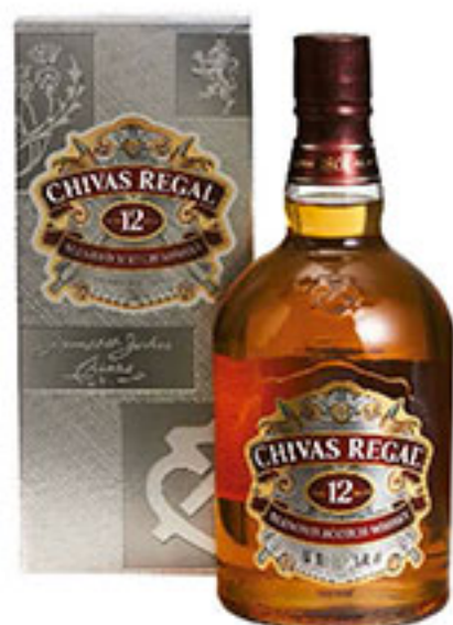
Whisky CHIVAS REGAL 1lt. $1,018 00