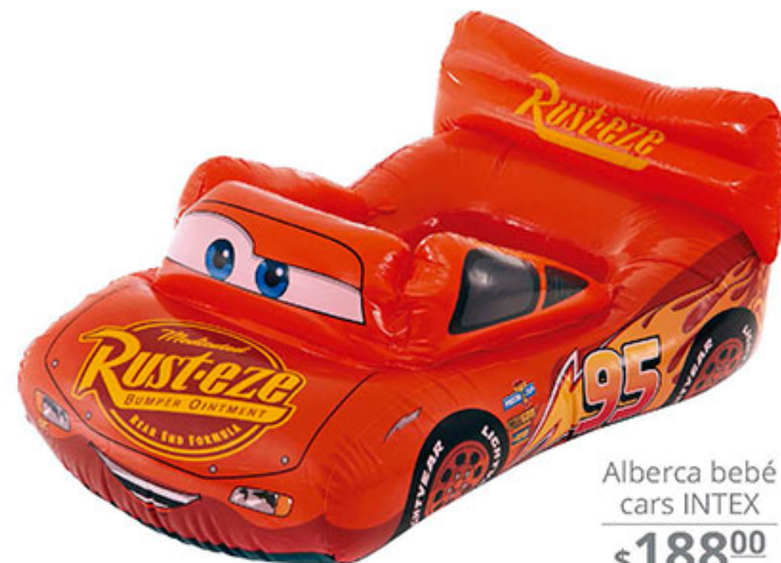
Alberca bebé cars INTEX $188 00