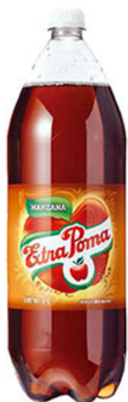
Refresco de manzana EXTRA POMA 2lt.