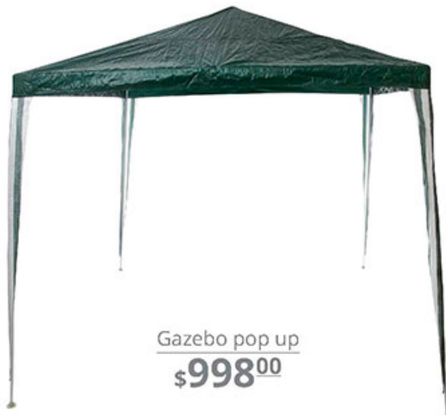
Gazebo pop up $998 00