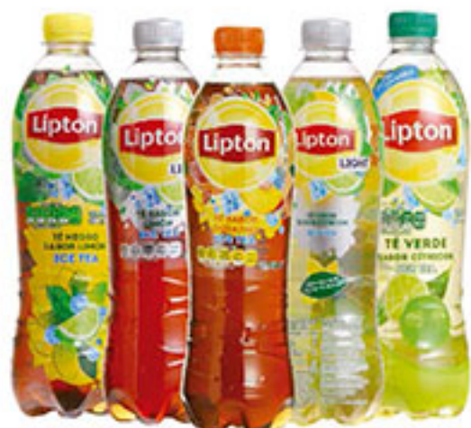
Bebida té LIPTON 600ml