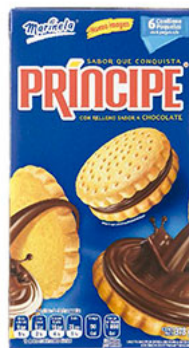
Príncipe con relleno sabor chocolate MARINELA 378g