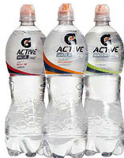
Bebida deportiva g active GATORADE 1lt.