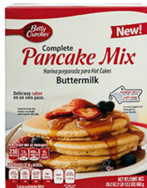
Harina preparada para hot cakes BETTY CROCKER 800g