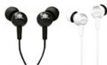
Audífonos in-ear negro o blanco JBL