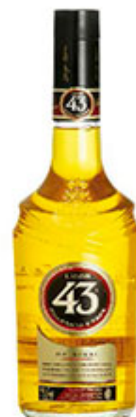
Licor 43 750ml $460 00