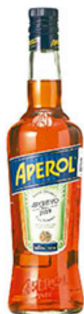
Licor APEROL 750ml $280 00