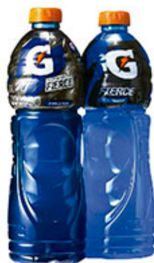
Bebida deportiva fierce GATORADE 1lt.