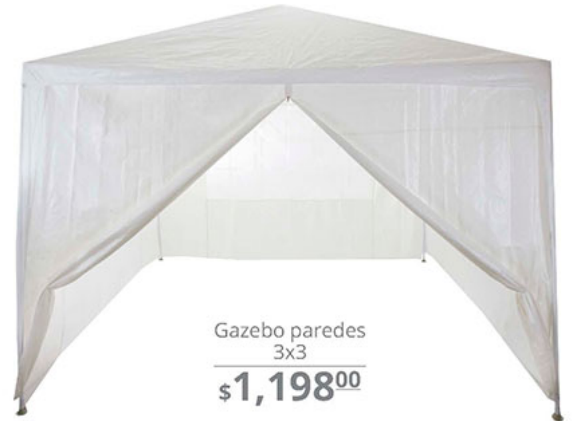
Gazebo paredes 3x3 $1,198 00