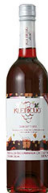
Cooler tinto KLERICUO 750ml $80 00