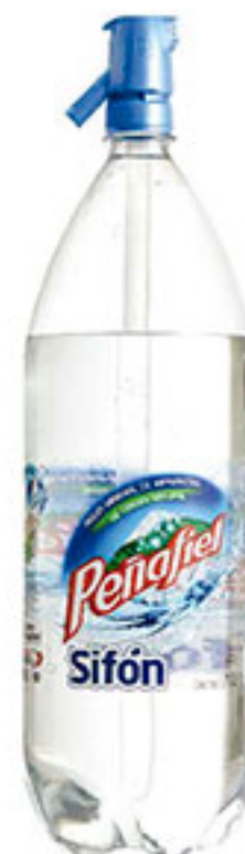
Agua mineral sifón PENAFIEL 1.75lt.