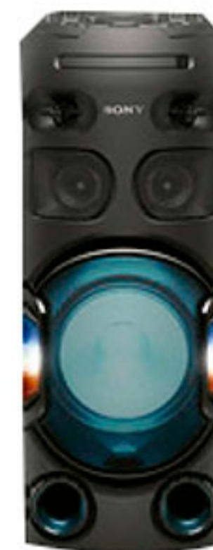
Sistema de audio SONY