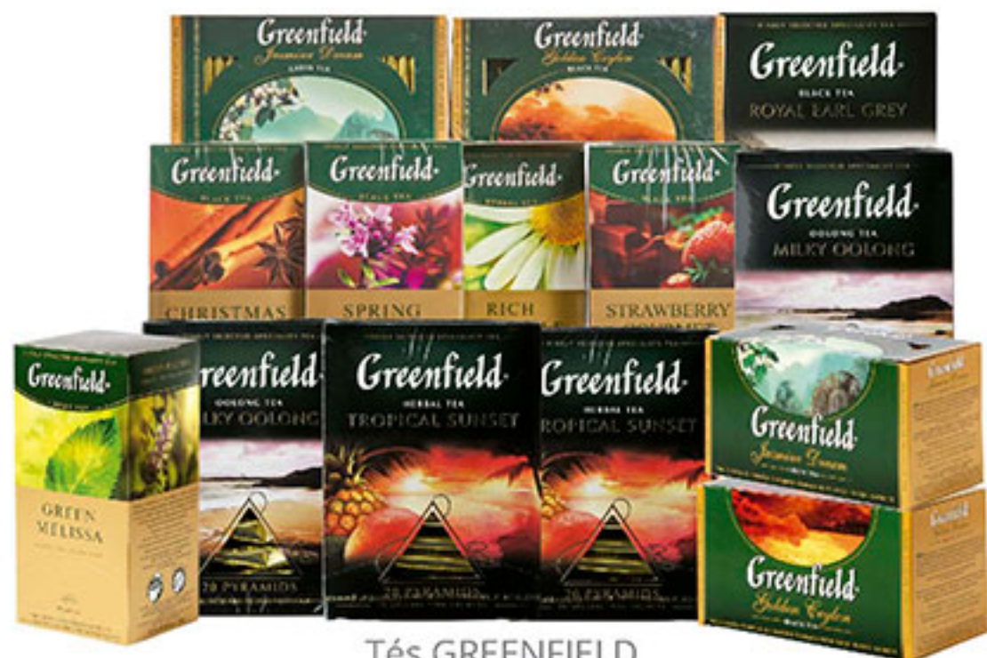
Tés GREENFIELD $58 50 C/U