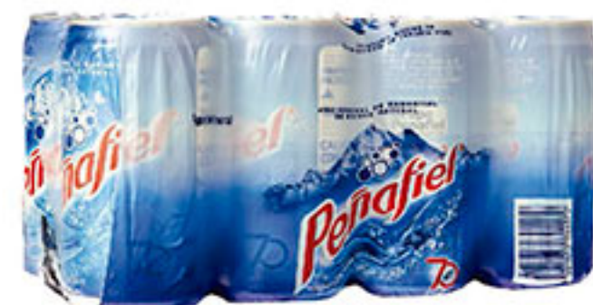
8 pack agua mineral PEÑAFIEL 237ml $60 00