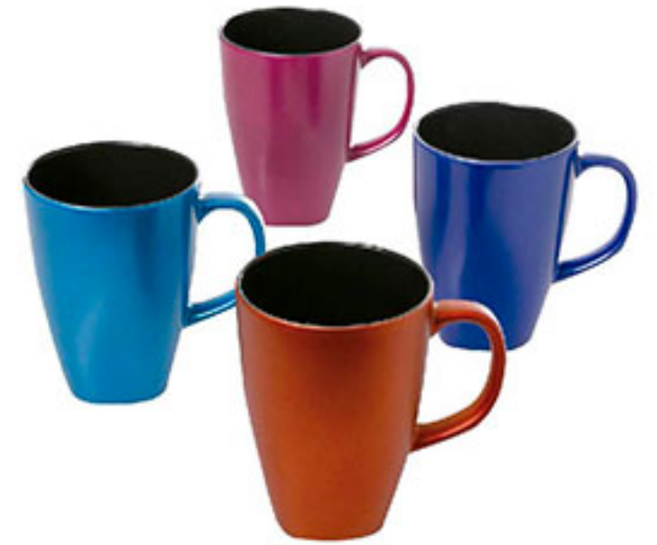
Tarro mr luster flare MR. COFFEE 16oz