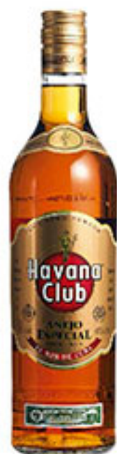
Ron añejo HAVANA CLUB 750ml $208 00