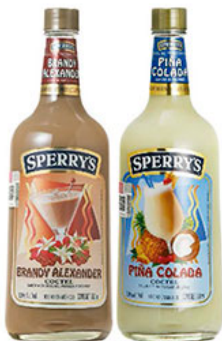
Coctel piña colada o brandy alexander SPERRY'S 750ml