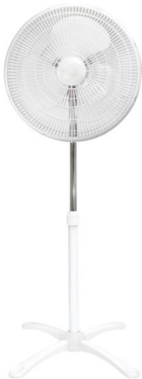
Ventilador de pedestal 16" MYTEK $398 00