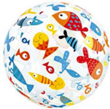
Pelota inflable lively 59040NP INTEX