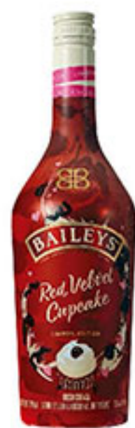
Crema irlandesa red velvet cupcake BAILEYS 750ml $351 00