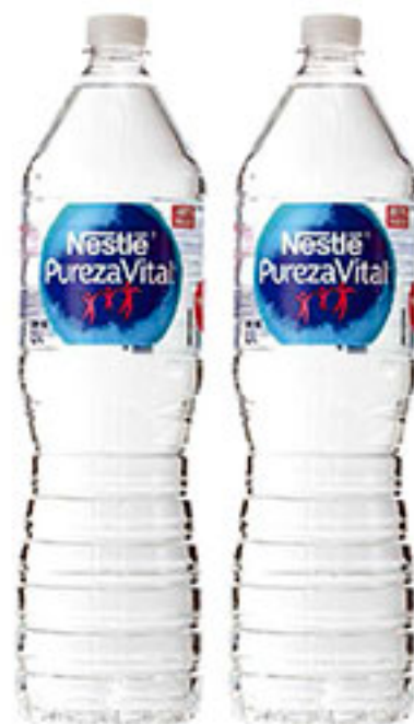
Agua natural PUREZA VITAL 1.5lt. compra una y llévate