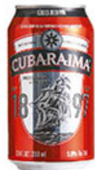
Cubaraima BARAIMA 345ml