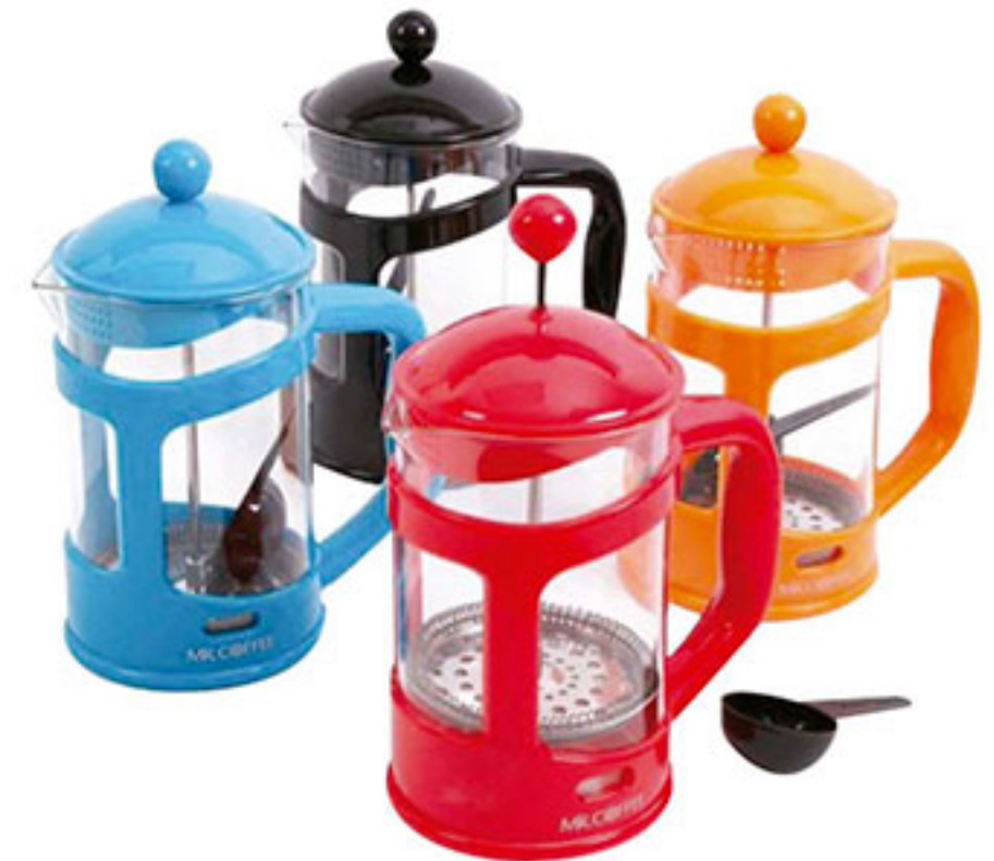
Prensa 4 colores MR. COFFEE 28oz