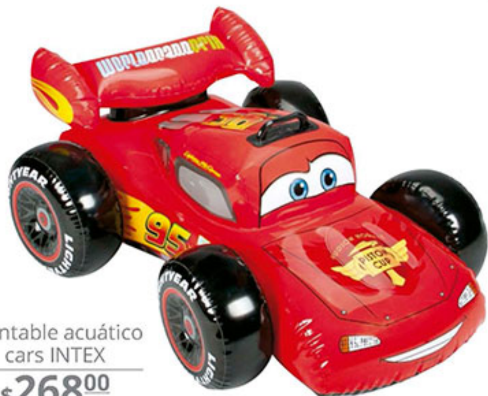
Montable acuático cars INTEX $268 00