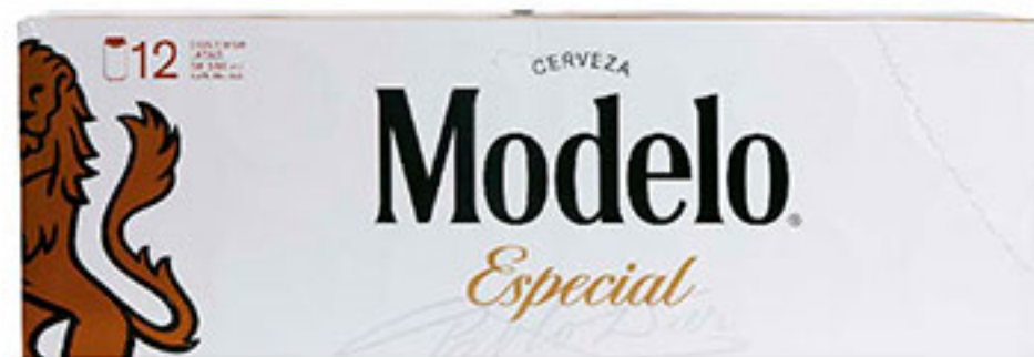
12 pack cerveza MODELO ESPECIAL 355ml