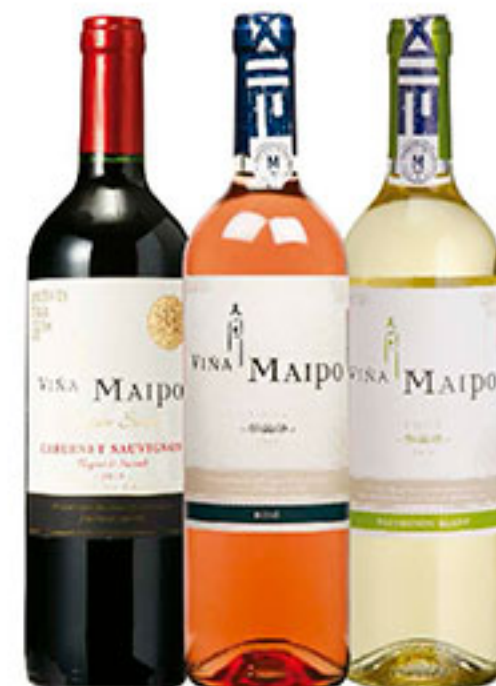
Vino blanco, rosado o tinto MAIPO 750ml