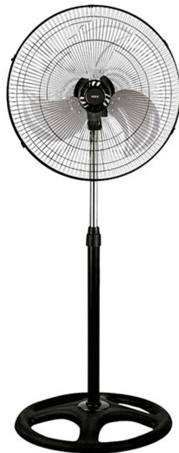
Ventilador de pedestal 18" negro RCA $998 00