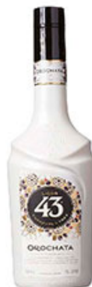
Licor 43 orochata 700ml $379 00