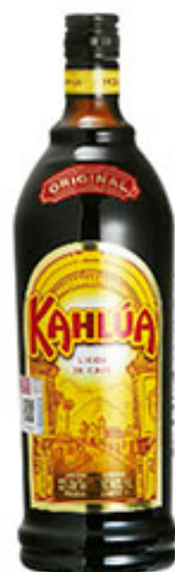
Licor de café KAHLÚA 1lt. $179 00