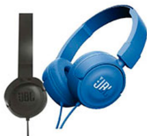
Audífonos on-ear negro o azul JBL