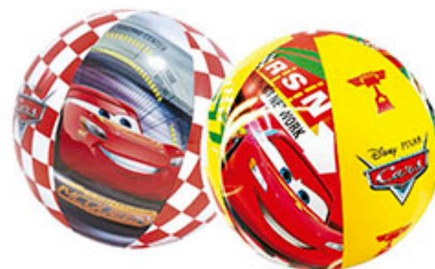
Pelota inflable para playa niño cars INTEX $48 00 c/u