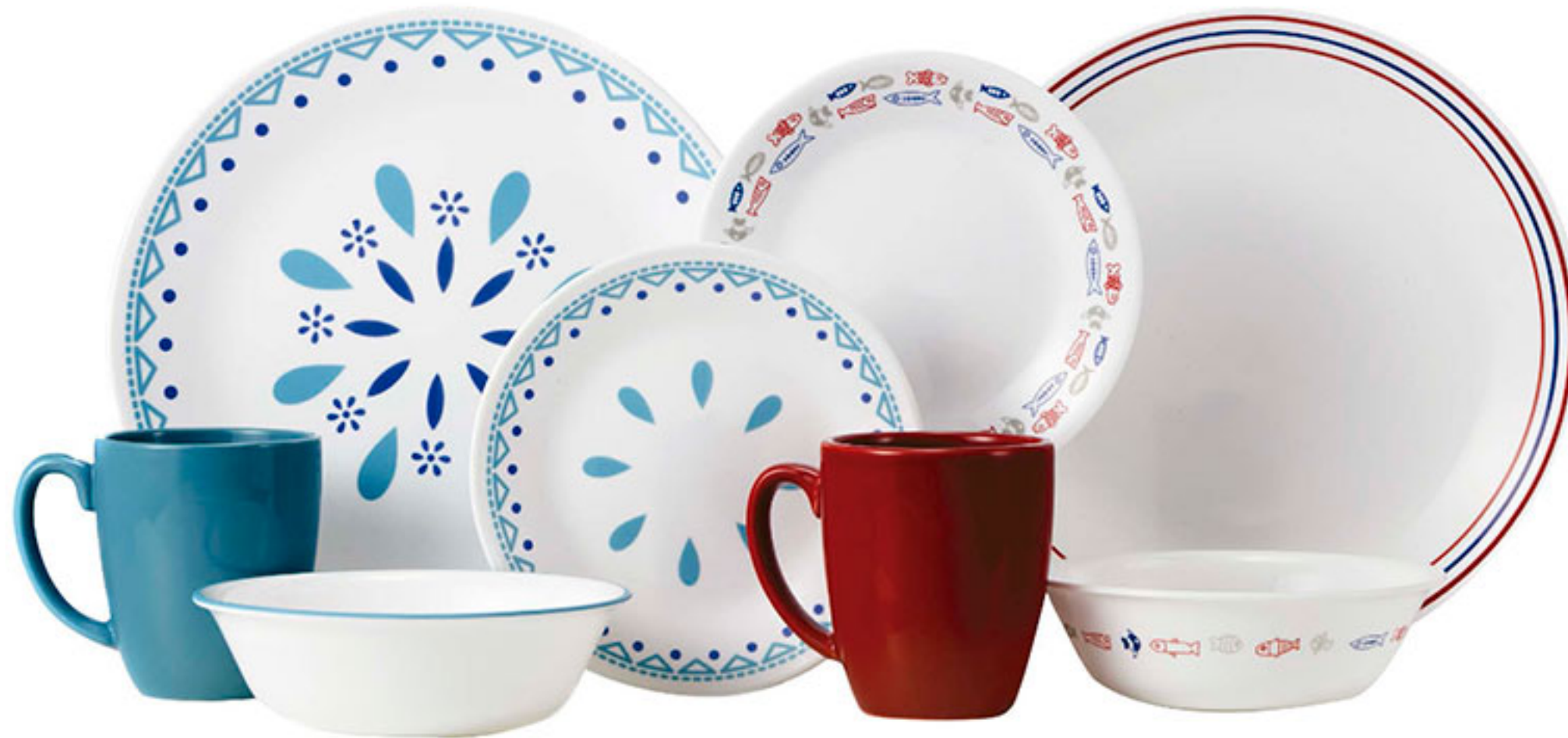
Set santorini sky o harbor town CORELLE 16pz