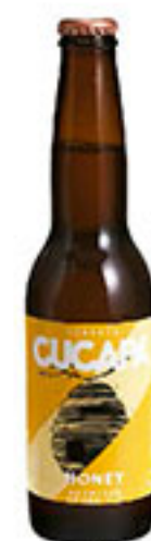
Cerveza honey CUCAPÁ 355ml