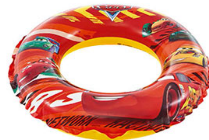
Flotador dona cars INTEX $38 00