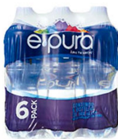
6 pack agua natural E-PURA 600ml