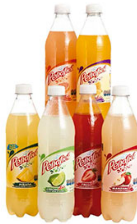
Agua mineral PENAFIEL 600ml