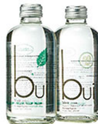
Agua gasificada BUI 290ml compra una y llévate