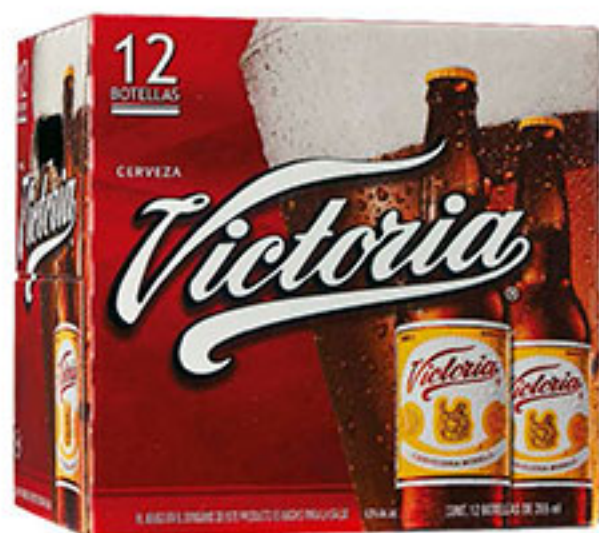
12 pack cerveza VICTORIA 355ml