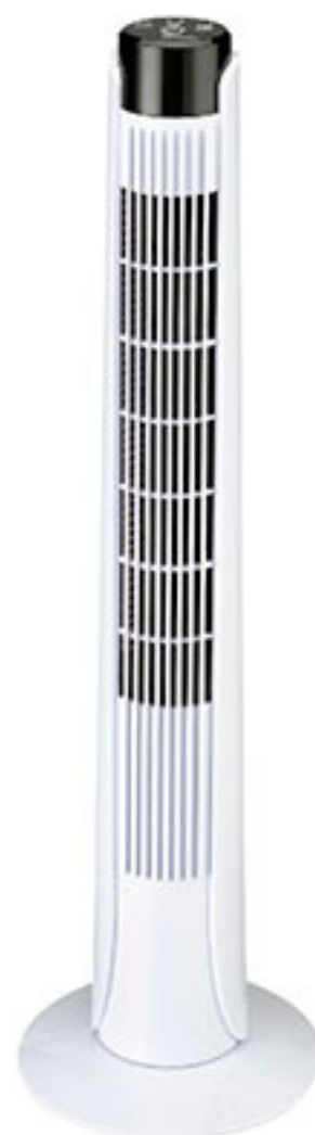
Ventilador de torre 36" LANDIA $998 00